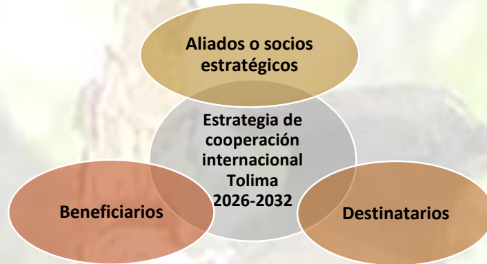
Ilustración 7: Sistema de actores para la cooperación internacional