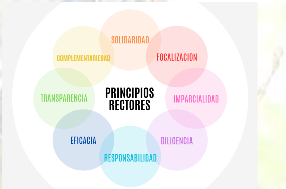
Ilustración 9: Principios rectores de la cooperación internacional en el Tolima