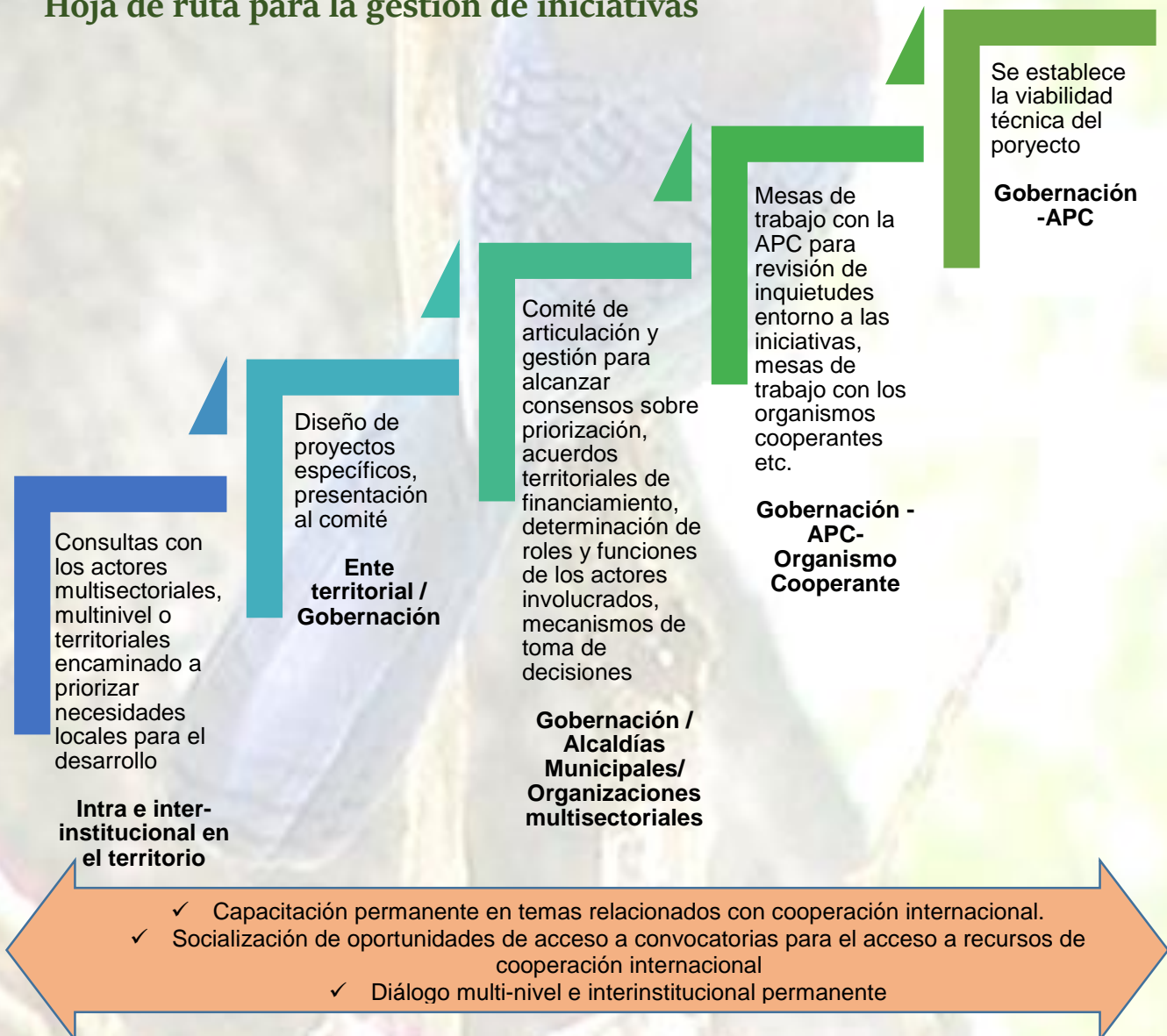
Ilustración 8 Ruta para la gestión de iniciativas